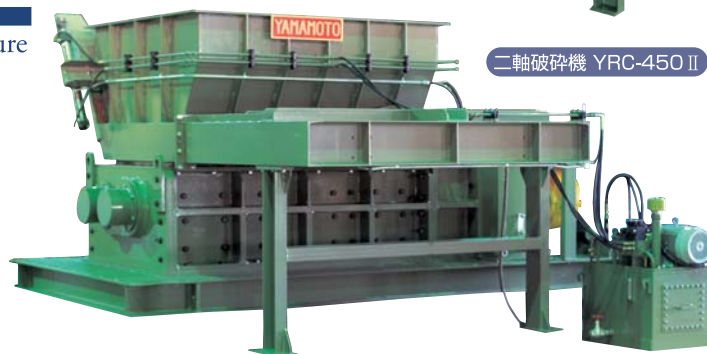
二軸破碎機 YRC-450 II