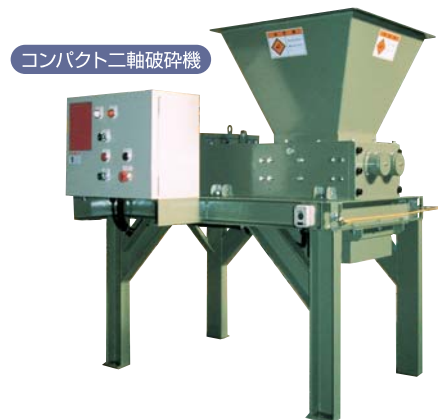
コンパクト二軸破碎機

※豊富なプラント実績から得られた経験を生かし、破碎ラインの対応も承ります。 ※駆動方式は油圧型・電動型から選定致します。